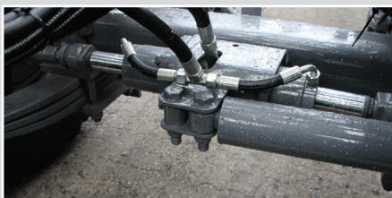
Drejbaraksel - 10 t. pr. aksel