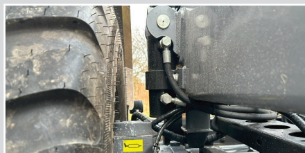
Hydraulisk bogie lås