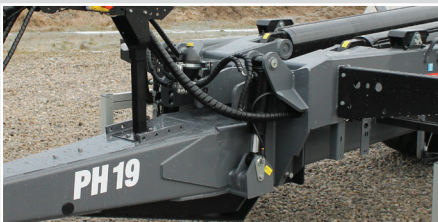
Hydraulisk affjedret træk